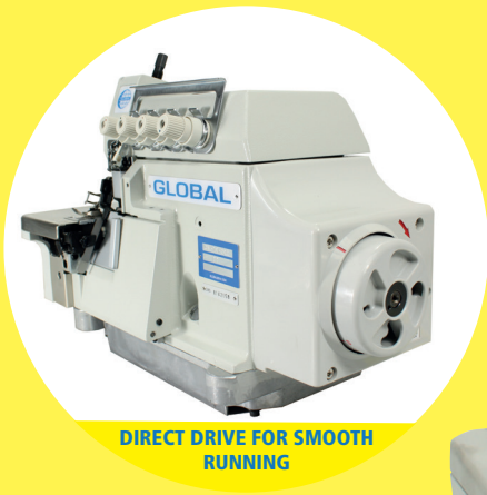
DIRECT DRIVE FOR SMOOTH RUNNING