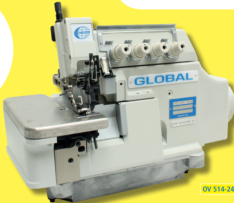
OV 514-240 DD