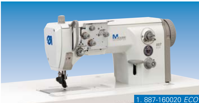
1. 887-160020 ECO

Une hausse de la capacité en fil de bobine (+70%) a permis de réduire considérablement le nombre de changements de bobines, même s'il s'agit de fils lourds.