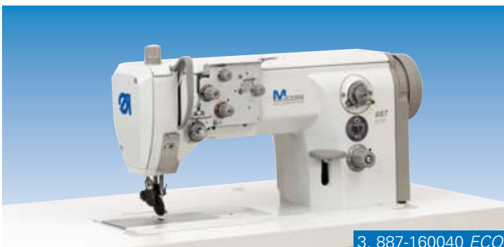
3. 887-160040 ECO