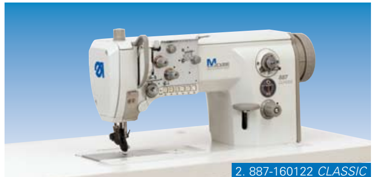
2. 887-160122 CLASSIC