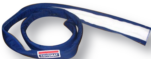
Gaine isolante Lg :2m