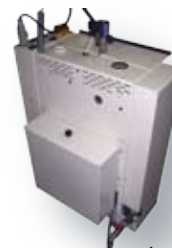
Générateur avec bache (option)