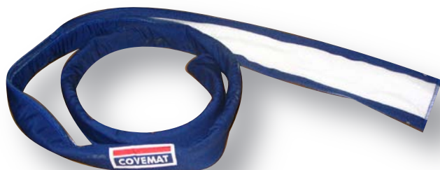
Gaine isolante Lg :2m